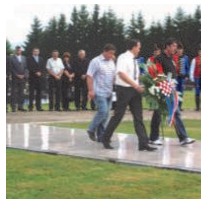
UVDR - Lopar

Osvrćući se na cjelokupni rad Udruge, pitamo se je li mogla biti bolja? Je li mogla učiniti nešto više za svoje članove? Možda. Je li Udruga nešto trebala učiniti drugačije? Ne znamo, ali dajemo sve od sebe, sve što znamo i to nas čini sretnima.